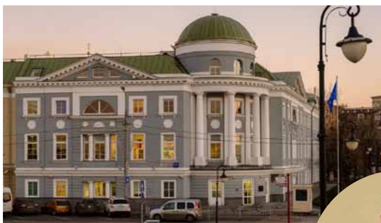
Заявку Екатеринбурга в представительстве ЕС в России представил губернатор Евгений Куйвашев .

«Большинство стран ЕС - торговые партнёры Среднего Урала, - сказал губернатор Евгений Куйвашев . - На них приходится более 30% общего внешнеторгового оборота области. Наиболее плотно мы сотрудничаем с Францией, Германией, Италией и Чехией».